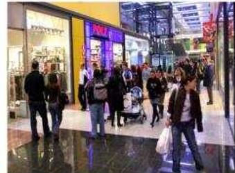
Cuando aumenta el nivel de consumo.